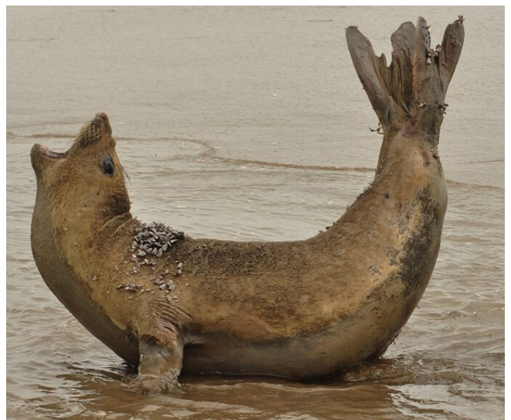
Ejemplar de Elefante Marino del Sur