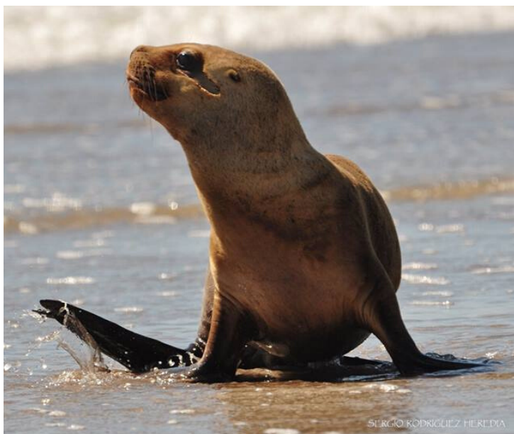
Ejemplar de Lobo Marino de 1 pelo

Además, entre estas dos especies existen muchas diferencias, una de ellas es el tamaño corporal, en el Lobo Marino de Un Pelo los machos adultos pueden alcanzar un peso de 300 kg y las hembras los 150 kg. Por el contrario, los machos adultos del Elefante Marino pueden pesar 4.000 kg y las hembras 900 kg aproximadamente, por este motivo se la considera como la foca de mayor tamaño que existe en el mundo. Por último, el tamaño de los ojos es diferente, en los Elefantes Marinos son excepcionalmente grandes, dada la necesidad de luz a grandes profundidades. ¡Se han registrado inmersiones de más 1.200 metros durante más de 2 horas de buceo! En cambio, el tamaño de los ojos del León Marino es menor ya que ellos pueden bucear hasta los 200 metros de profundidad y el tiempo que pueden estar bajo el agua sin respirar es de 7 minutos ¡Recuerden que los lobos marinos y focas son mamíferos marinos que respiran aire como nosotros!